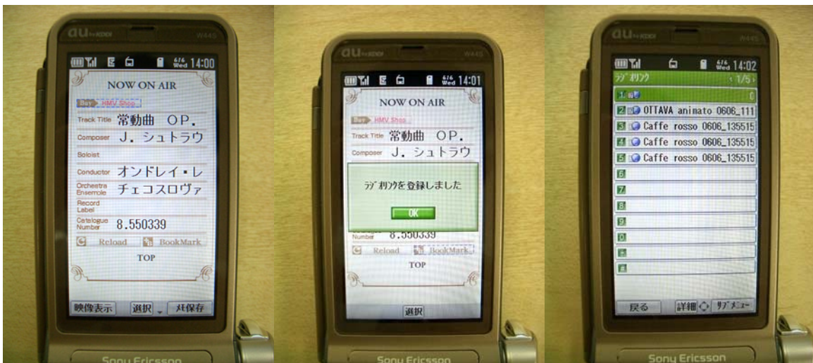
図 1 NOWONAIR (左)。BOOKMARK (中)。BOOKMARK 一覧 (右)。

この「NOW ON AIR」画面から、楽曲情報に含まれる CD 番号を基に、HMV 殿もしくは e-onkyo 殿の楽曲購入サイトの URL を取得、表示し、放送中は楽曲を聴きながら、放送後も「BOOK MARK」(ラジオリンク)を経由して楽曲を購入することが出来ます。また、HMV についてはデジタルラジオ対応携帯で聴取している場合には携帯サイトへ、USB 型受信機などで聴取している場合には PC サイトに、それぞれ遷移するようになっています。